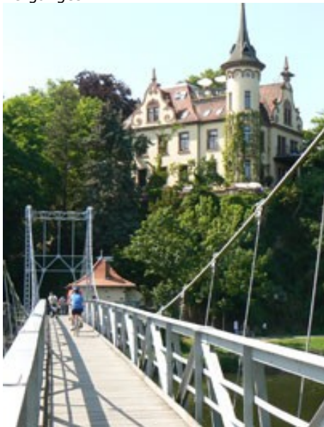
Hängebrücke mit Geldeinnehmerhäuschen

Vorbei an der Hängebrücke mit dem "Geldeinnehmerhäuschen" kommen wir zur Schiffsanlegestelle. Hier endet der erste Teil unseres Stadtsparzierganges.