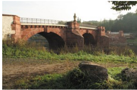
Die Pöppelmannbrücke mit Wappenstein

In Grimma wenden wir uns nach links vorbei an dem nach der Flut von 2002 errichteten „Hochwasseranzeiger“ zur zerstörten Muldenbrücke („Pöppelmannbrücke“). Sie wurde 1716-1719 nach Plänen von Pöppelmann errichtet. Durch die Jahrhundertflut vom Sommer 2002 wurde sie erheblich beschädigt und im Dezember 2002 zur gegenwärtigen Ruine gestaltet. Zu beachten ist der Wappenstein von 1724.