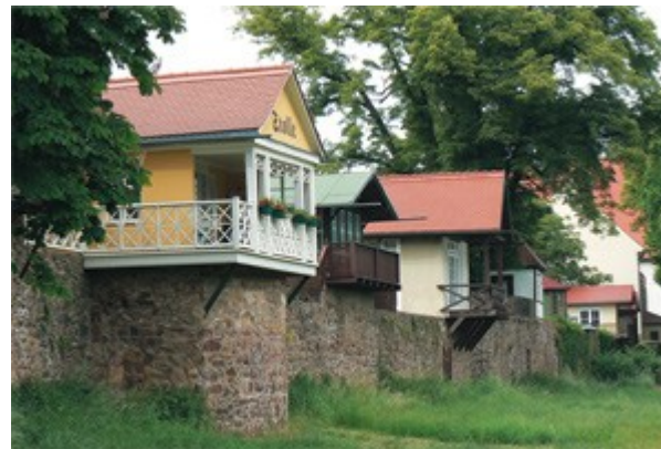
Gartenlauben auf den Resten der Stadtmauer

Direkt am Ufer führt nun ein schmaler Weg am Fluß entlang, vorbei am Gymnasium St. Augustin. Es war einst eine der drei sächsischen Landesschulen. Gleich anschließend steht die Klosterkirche, die vor dem Verfall gerettet wurde. Wir empfehlen einen Abstecher hinauf zum Kreismuseum. Interessant ist auch die Stadtmauer mit den Gartenlauben darauf.