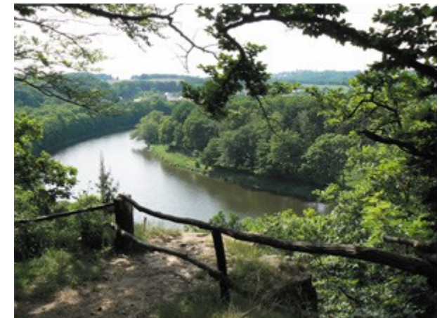
Blick von der Feueresse auf das Muldental

Wir gehen zurück links die Schloßstraße entlang. Hinter dem Haus Nr. 9 biegen wir links auf den Zettenweg ein. (So genannt nach dem „Zettenwall“, der eine frühgeschichtliche Ansiedlung, vermutlich aus der Bronzezeit, von der Größe der Grimmaer Altstadt einschloß. Allerdings ist der Wall durch die vergangenen Jahrhunderte nicht mehr zu erkennen.) Danach kommen wir zum Aussichtspunkt „Feueresse“.