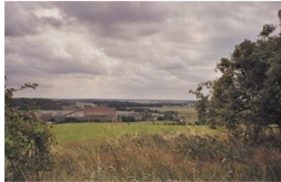
Blick vom Windmühlenberg

An der nächsten Weggabel halten wir uns links, wir gehen an einer Wiese entlang und wieder im Wald rechts hinauf auf einen bewaldeten Höhenzug. Die gelbe Markierung führt uns am Vogelberg vorbei und an einer Kreuzung nach links und im weiten Rechtsbogen auf den Gipfel des 207 m hohen Lindberges.