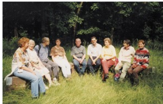
Leipziger Naturfreunde an der Roten Bank

Beim Abstieg achten wir rechts auf das Zeichen „Grünes N und roter Pfeil“. Es führt uns zur Roten Bank mitten im Wald, einem beliebten Treffpunkt der Leipziger Naturfreunde schon vor 80 Jahren.